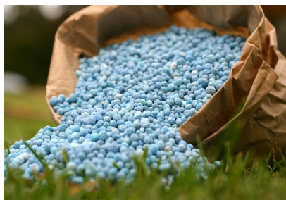
Exemple d'engrais minéral vendu dans le commerce